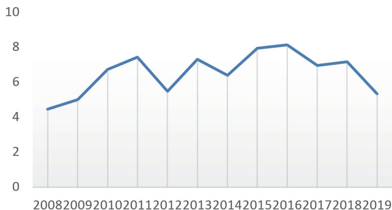
图 1 印度居民消费支出增长率（2008–2019 年） [1]

需成为印度经济的当务之急。“自给印度”计划正是着眼于此，是为了保全内需不被外国商品“侵蚀”，而推出 20 万亿卢比的经济刺激计划，尤其是扶助就业、给予低收入家庭直接补贴等措施，实际目的也是落脚于刺激消费复苏、保障内需上。